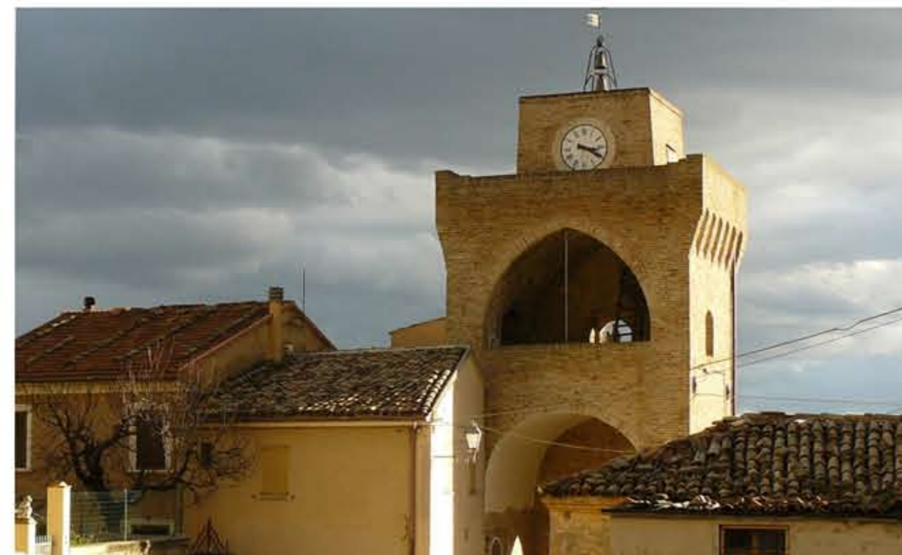
adozione: delibera CC n. del